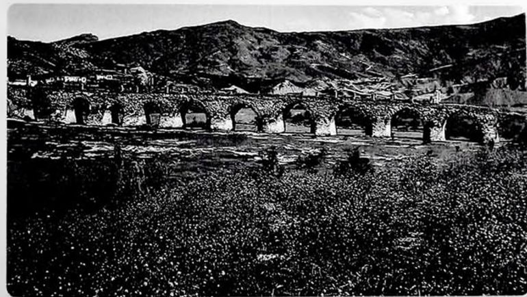
Təbriz yaxınlığındakı Əndəbil kəndindən Gəncəyə gedən yol. Xudafərin körpüsü.