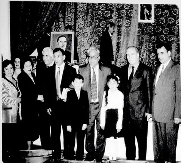
Gəncə, Mir Cəlalin yubiley tədbiri.