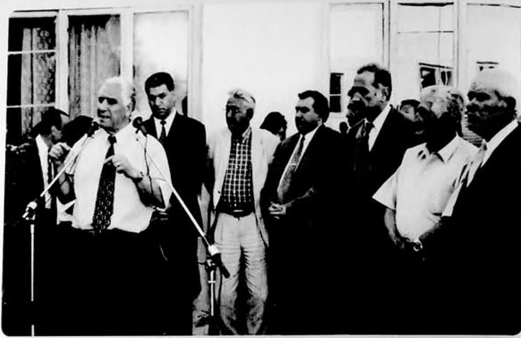
Şəmkirdə Mir Cəlal adına küçənin açılışı zamanı.

Müharibə Mir Cəlalin "qəlbində alovlu qəzəb" oyatmışdı. O, müharibə dəhşətlərini gözüylə görün yazıçılarımdandı. Əlinə silah götürüb bilavasitə vuruşmasa da, gedib aylarla müharibə cəbhəsində qalmış, azərbaycanlı döyüşçülər qarşısında bir sıra dəyərli mühazirələr oxumuşdur.