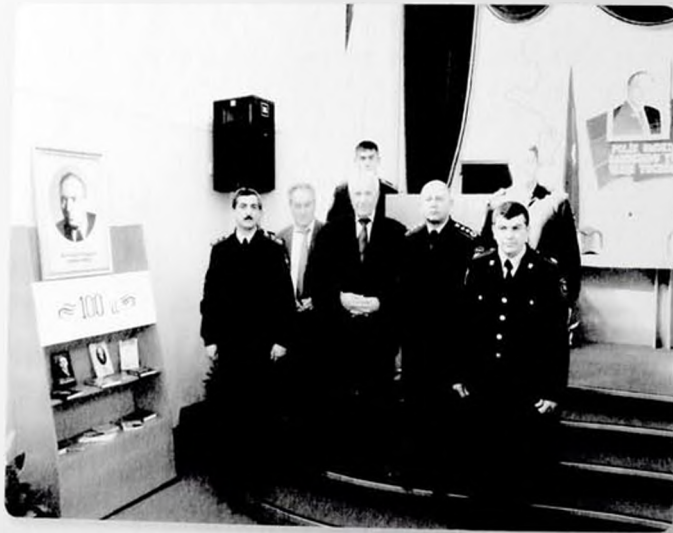
Mir Cəlal Paşayevin 100 illik yubileyində. Polis Akademiyası.