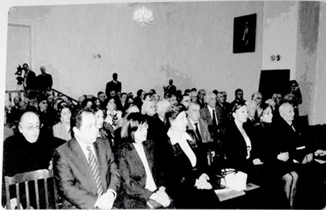
Azərbaycan Milli Elmlər Akademiyasında Mir Cəlalın yubiley tədbiri.