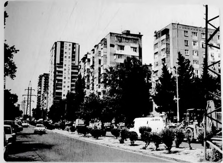
Bakı şəhəri, Mir Cəlal küçəsi.

...Xalqımız öz sənətkar, alim oğlunun xatirəsini əziz tutur. Onun yaradıcılığı orta və ali məktəblərdə geniş tədris olunur, əsərləri təkrar-təkrar nəşr edilib gələn nəsillərə çatdırılır.