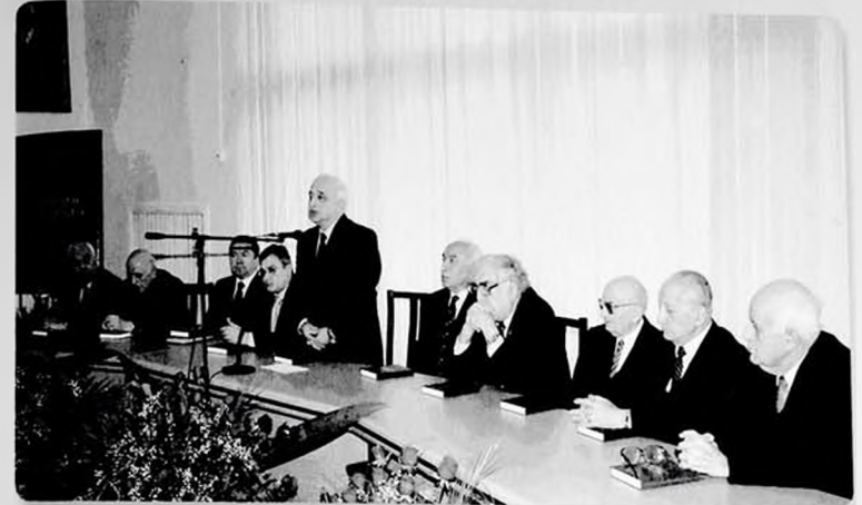
Görkəmli yazıçı, alim və pedaqoq Mir Cəlal Paşayevin "Azərbaycanda ədəbi məktəblər" kitabının təqdimat mərasimi.