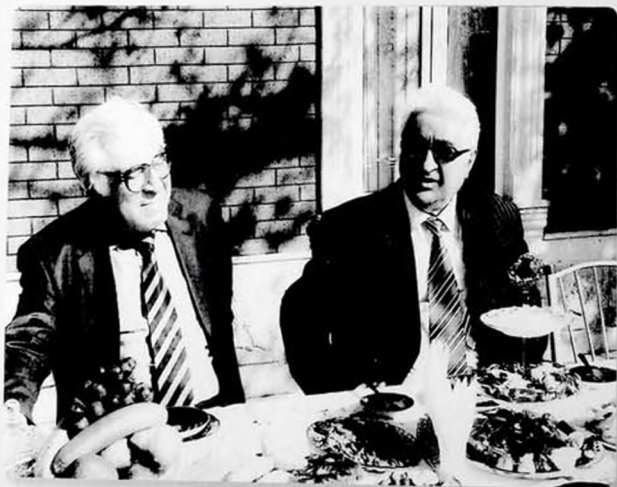
Akademik Arif Paşayev və Xalq yazıçısı Anar. Gəncə, 2008-ci il.