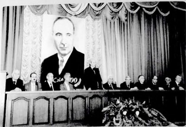
Azərbaycan Dövlət Pedaqoji Universitetində görkəmli alim, nasir, böyük müəllim Mir Cəlal Paşayevin anadan olmasının 100 illik yubileyinə həsr olunmuş tədbir