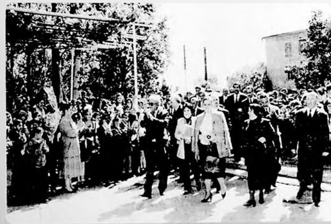
Yubiley tədbirləri. Gəncə. Aprel, 2008-ci il.