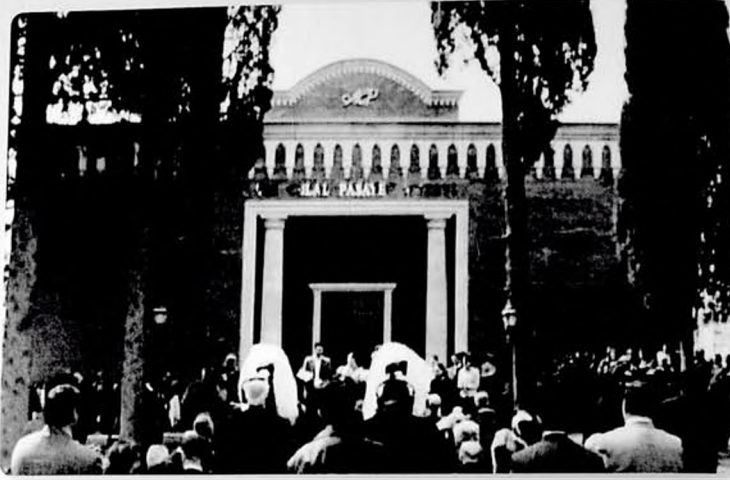
Mir Cəlalin ev muzeyinin açılışında. Gəncə, aprel, 2008-ci il.

Mir Cəlal Paşayevin Gəncədəki ev muzeyi fəhərin qədim, sakit və həy-küydən uzaq bir məhəlləsində – Bayan küçəsində yerləşir. Qırmızı kərpicdən tikilmiş birmərtəbəli yaraşlıq muzey binası qarşısında sərv ağacları ucalır. Mir Cəlal gənlik dövründə Bayan küçəsində yaşayıb. Muzey görkəmli ədəbin 100 illik yubileyi ərəfəsində tikilib istifadəyə verilmişdir.