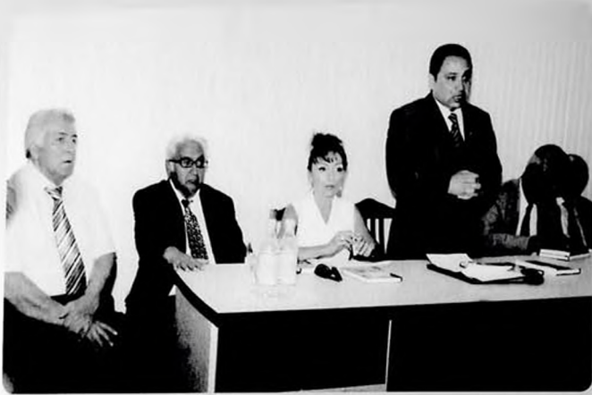
Bakı Dövlət Universitetində