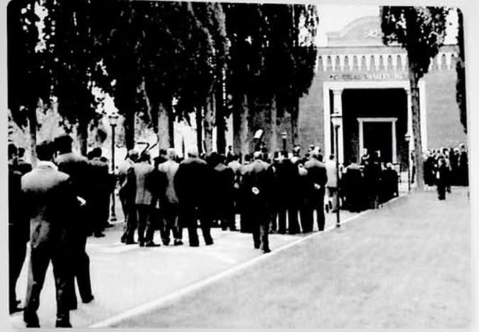
Mir Cəlalin ev muzeyinin açılışında. Gəncə, aprel 2008-ci il.

Mir Cəlal Paşayevin Gəncədəki ev muzeyi fəhərin qədim, sakit və həy-küydən uzaq bir məhəlləsində – Bayan küçəsində yerləşir. Qırmızı kərpicdən tikilmiş birmərtəbəli yaraşlıq muzey binası qarşısında sərv ağacları ucalır. Mir Cəlal gənlik dövründə Bayan küçəsində yaşayıb. Muzey görkəmli ədəbin 100 illik yubileyi ərəfəsində tikilib istifadəyə verilmişdir.