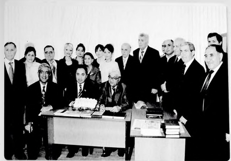
Bakı Dövlət Universitetində yubiley tədbiri

Aprelin 26-da Bakı Dövlət Universitetində Azərbaycan ədəbiyyatının və elminin inkişafında böyük xidmətləri olan görkəmli yazıçı, alim və pedaqoq, professor Mir Cəlal Paşayevin vaxtilə rəhbərlik etdiyi "Azərbaycan ədəbiyyatı tarixi" kafedrasının önündə bələyefinin açılışı olmuşdur.