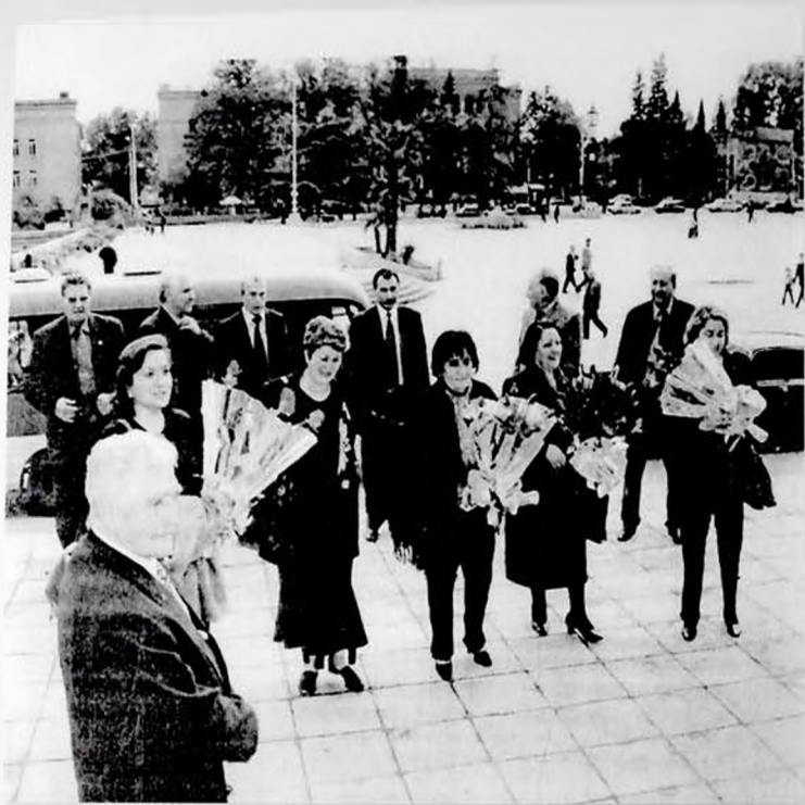
Mir Cəlalin ev muzeyinin açılışı zamanı Gəncəyə gələn nümayəndələr. 2008-ci il.