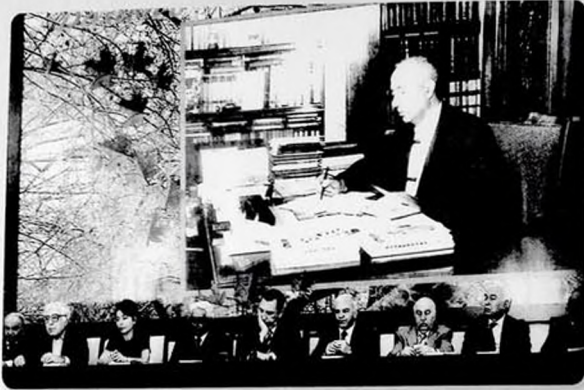
Mir Cəlalın 100 illik yubileyinə həsr olunmuş təntənəli yığıncaq. Gəncə. Aprel, 2008-ci il.