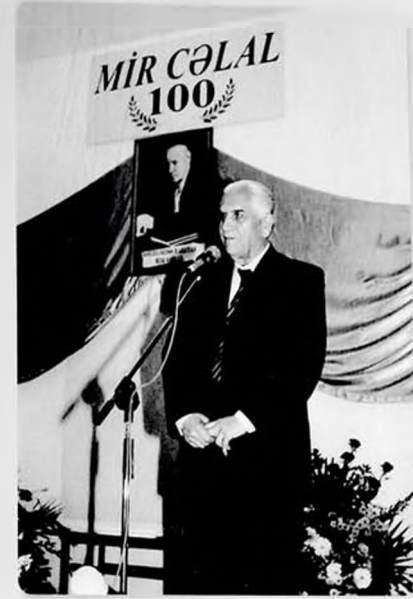
N.Həsənzadə Kürdəmir rayonunda Mir Cəlalin yubiley gecəsində çıxış edir. 2008-ci il.

Universitet mənim gənliyim, tərcümeyi-halımı bir hissəsidir. Mən orada böyük yazıçı, böyük alim Mir Cəlal Paşayevi gördüm, ömürlük sevdim, o, mənim mənəvi atam oldu. Mir Cəlalin özü mənim üçün ayrıca bir universitet idi. Onun kafedrası ayrıca "Yazıçılar İttifaqı" idi.