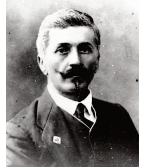
Həsən bəy Ağayev Azərbaycan Məclisi-Məbusan Rəyasəti Baş müavini

eşq ilə hürriyyətin arasında öylə böyük-böyük uçurumlar, mümaniətlər [manea-lər] mövcuddur ki, buralardan millət karvanını təhlükəsiz bir üsulla keçirmək üçün hürriyyətpərvər şüəramızdan böyük zəka və məharətlər tələb olunur. İndi baxalım ki, şüəramız bizi bu uçurumlardan nə kimi vasitələrlə xilas etmişlər.