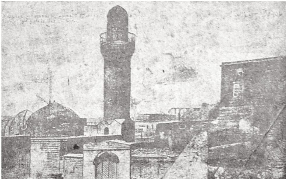
Bakıda qədim Xan sarayı